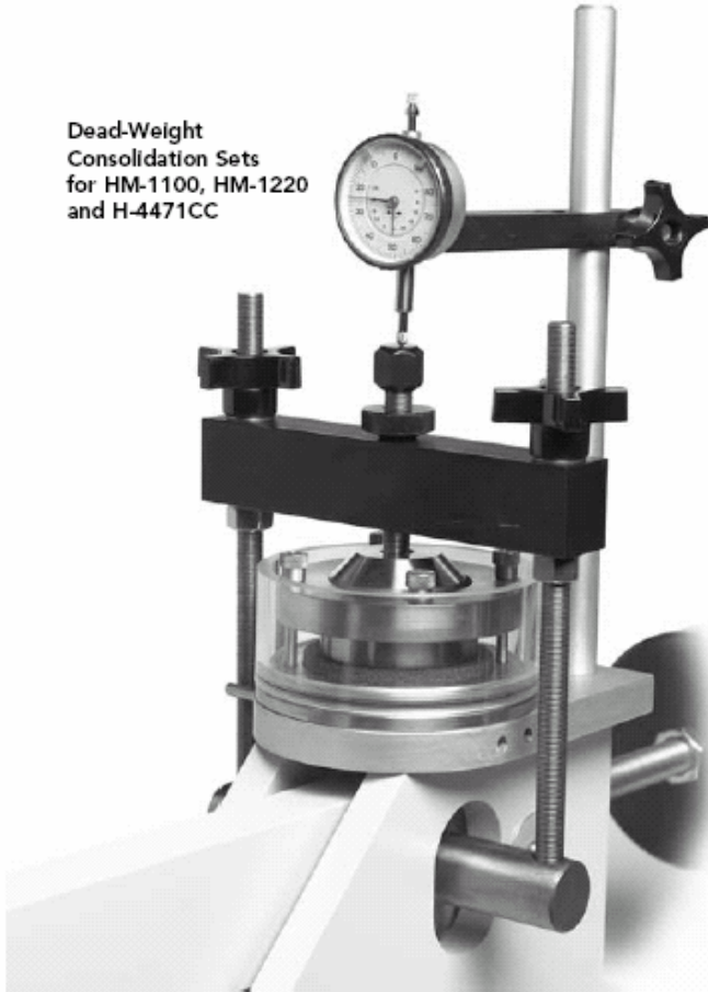
Dead-Weight Consolidation Sets for HM-1100, HM-1220 and H-4471CC